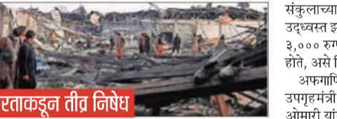
भारताकडून तीव्र निषेध