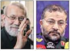
अली लारिजानी जन. सोलेमनी